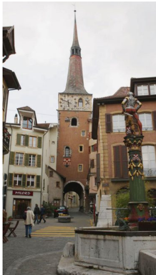
La Tour rouge, passage obligé des huguenots en exil, et la fontaine de la Justice, dont la statue a été réalisée par un réfugié protestant, se trouvent sur le tronçon La Neuveville-Nidau.